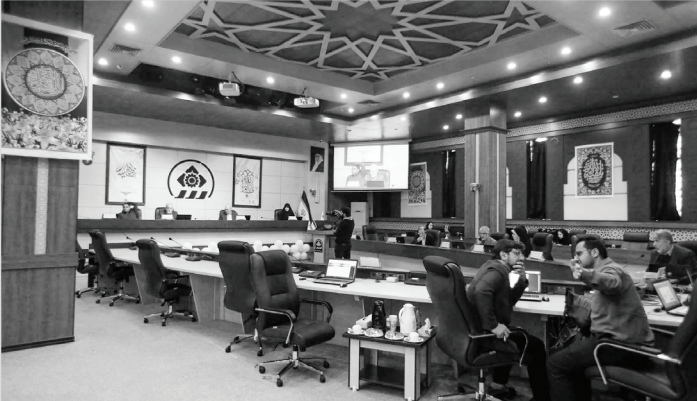
رئیس کمیسیون خدمات شهری شورای اسلامی شیراز

شهرداری شیراز ۵۵۰۰ میلیارد تومان بوده است که مجموع وام، فروش زمین، فروش سرقفلی و اوراق مشارکت ۳۴/۵ درصد بودجه را تشکیل می‌داد.